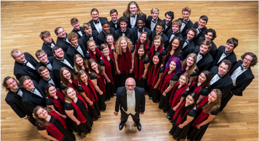
Bethel-College-Choir 2022 bei seinem Besuch bei der Baptistengemeinde in Schöneberg in Berlin