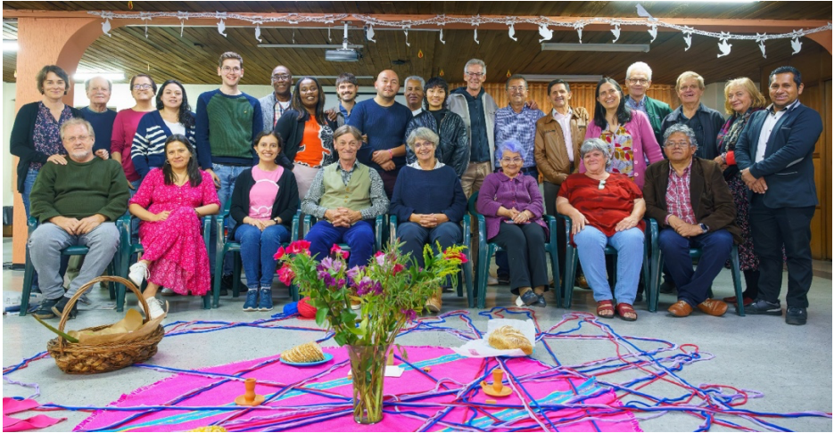
AMG-Delegation 2024 in Bogota, Kolumbien