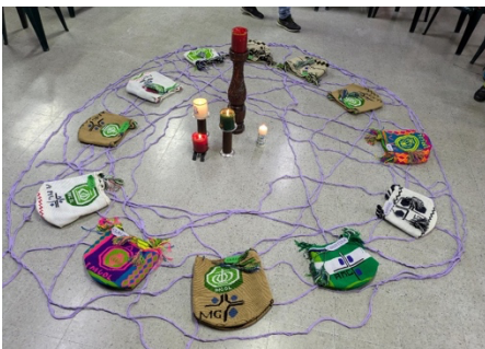
Jedes Delegationsmitglied bekam eine individuell gestaltete Umhängetasche